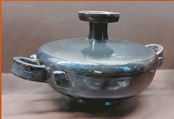
Διακόσμηση με υάλωμα